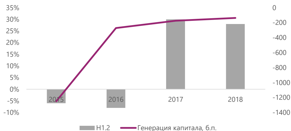
Рисунок 2. Достаточность и генерация капитала Банка «Солидарность» с 2015 по 2018 год

В период с 2014 по 2018 год способность Банка к генерации собственного капитала оставалась низкой. За последние пять лет коэффициент усредненной генерации капитала (КУГК) составил -194 б. п. В 2014–2016 годах Банк «Солидарность» показывал значительные убытки в связи с резким ростом объема создаваемых резервов. Частичное восстановление резервов в 2017 и 2018 годах существенно повлияло на формирование финансового результата Банка.