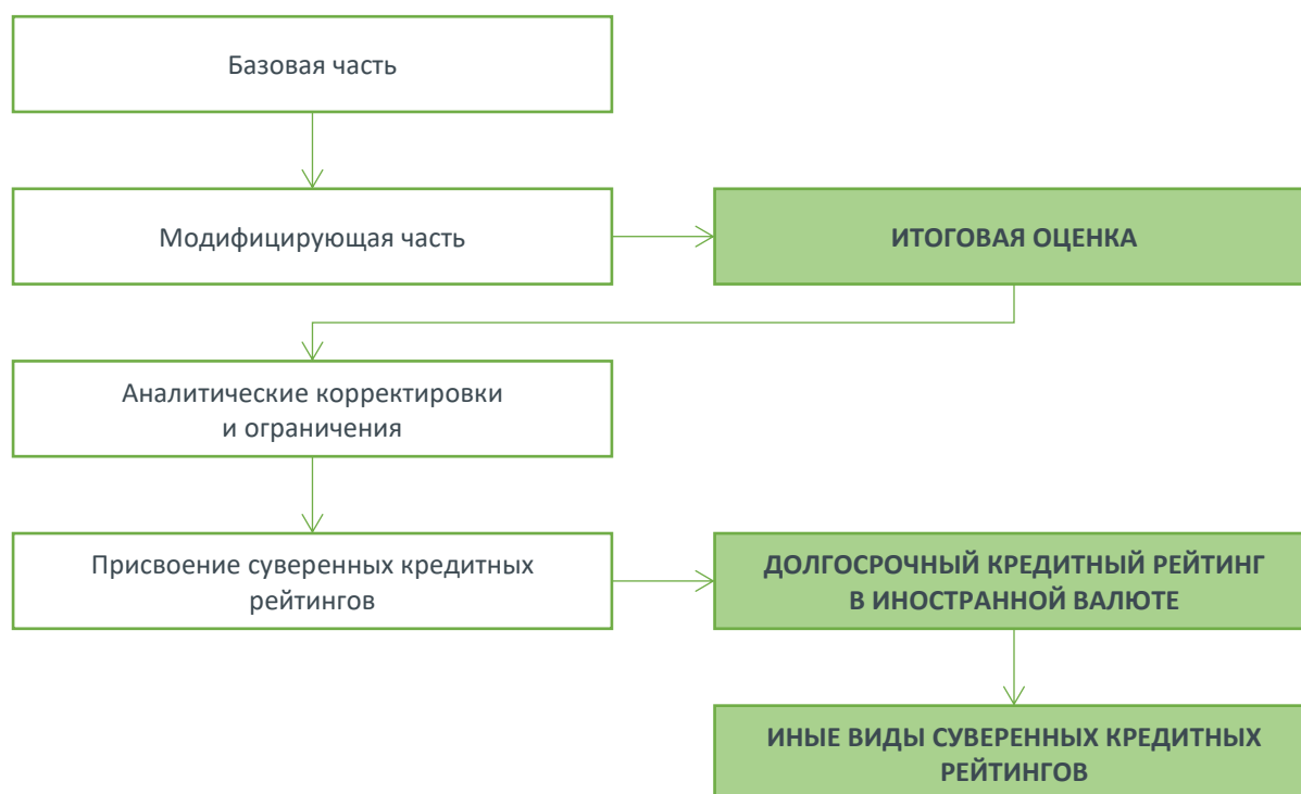
РИСУНОК 1. ОСНОВНЫЕ ЭТАПЫ РЕЙТИНГОВОГО АНАЛИЗА (СЛЕВА) И ОСНОВНЫЕ РЕЗУЛЬТАТЫ ЭТАПОВ (СПРАВА)

Детальная структура рейтингового анализа представлена в Приложении 1.