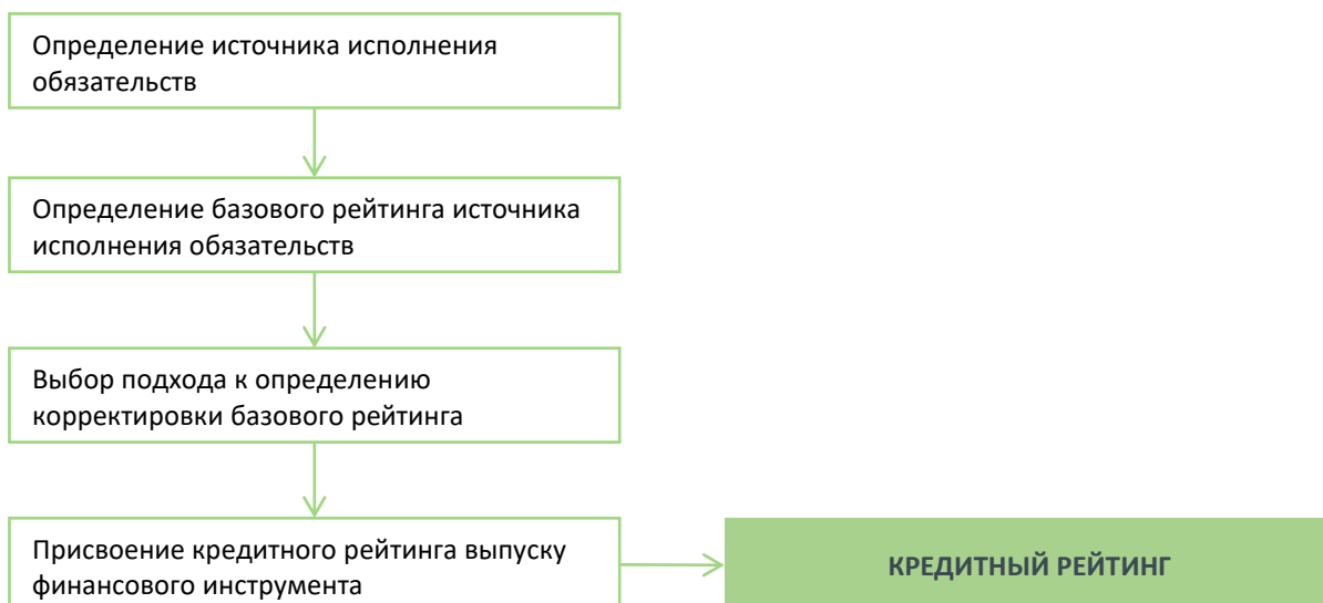
РИСУНОК 1. СТРУКТУРА РЕЙТИНГОВОГО АНАЛИЗА