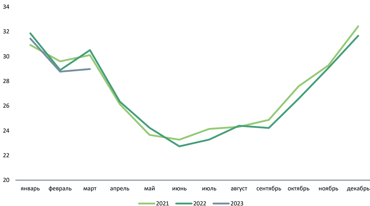
Рисунок 1. Динамика суммарного показателя отпущенной электроэнергии в России в 2021–2023 годах (отпуск категории «Прочие потребители», млрд кВтч)