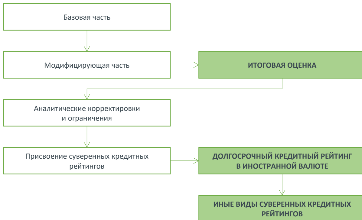
РИСУНОК 1. ОСНОВНЫЕ ЭТАПЫ РЕЙТИНГОВОГО АНАЛИЗА (СЛЕВА) И ОСНОВНЫЕ РЕЗУЛЬТАТЫ ЭТАПОВ (СПРАВА)

Детальная структура рейтингового анализа представлена в Приложении 1.